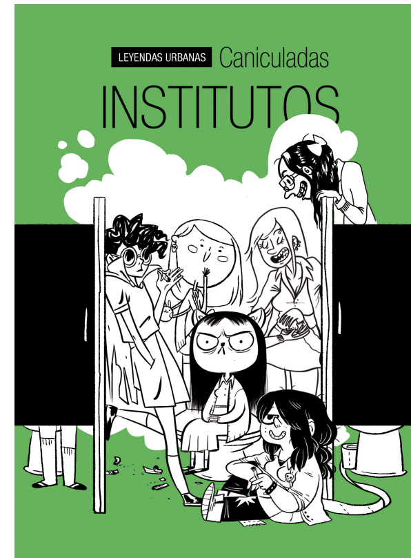
Caniculadas, Institutos (Astiberri, 2014).